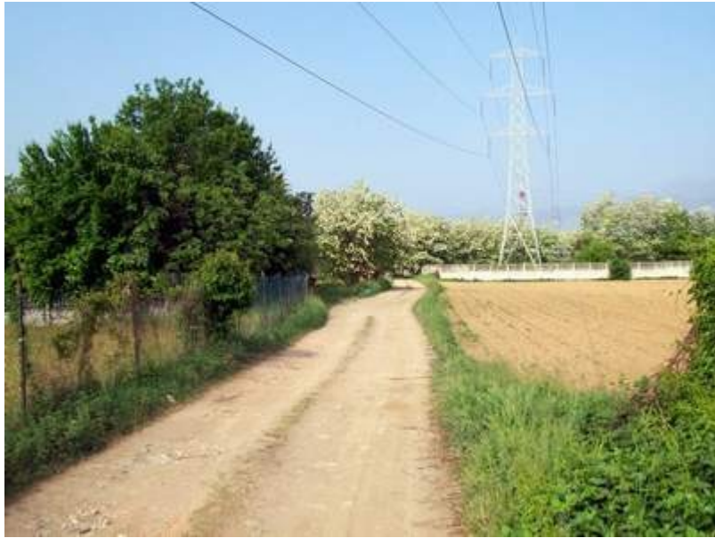
Foto della strada Trincea delle Frasche