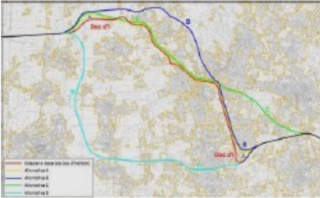
In azzurro la vecchia ipotesi di tracciato nelle Groane

E' una proposta per ampliare e riqualificare l'attuale tracciato della Monza-Saronno a partire da Cesano ?