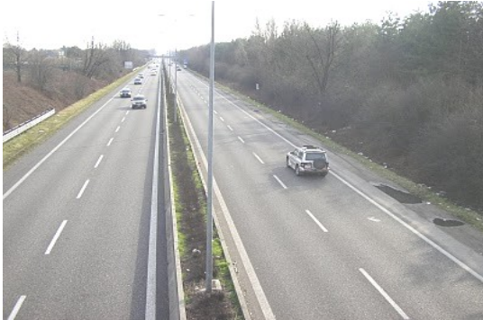
La superstrada Milano - Meda - Lentate

In diverse occasioni, il coordinamento di INSIEME IN RETE PER UNO SVILUPPO SOSTENIBILE, ha evidenziato le criticità irrisolte del tracciato dell'autostrada Pedemontana che va da Bovisio Masciago a Lentate sul Seveso.