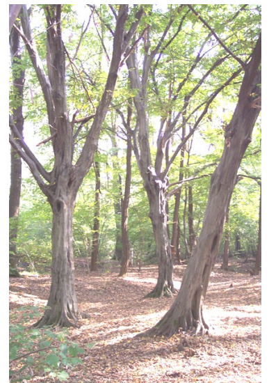
Carpini nelle Groane