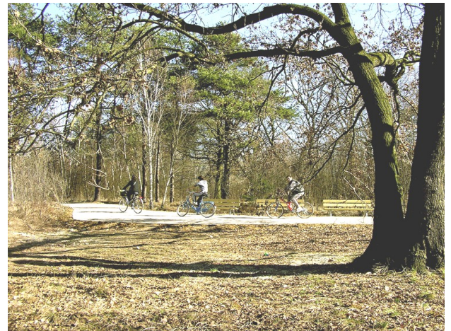
Piste ciclabili nelle Groane